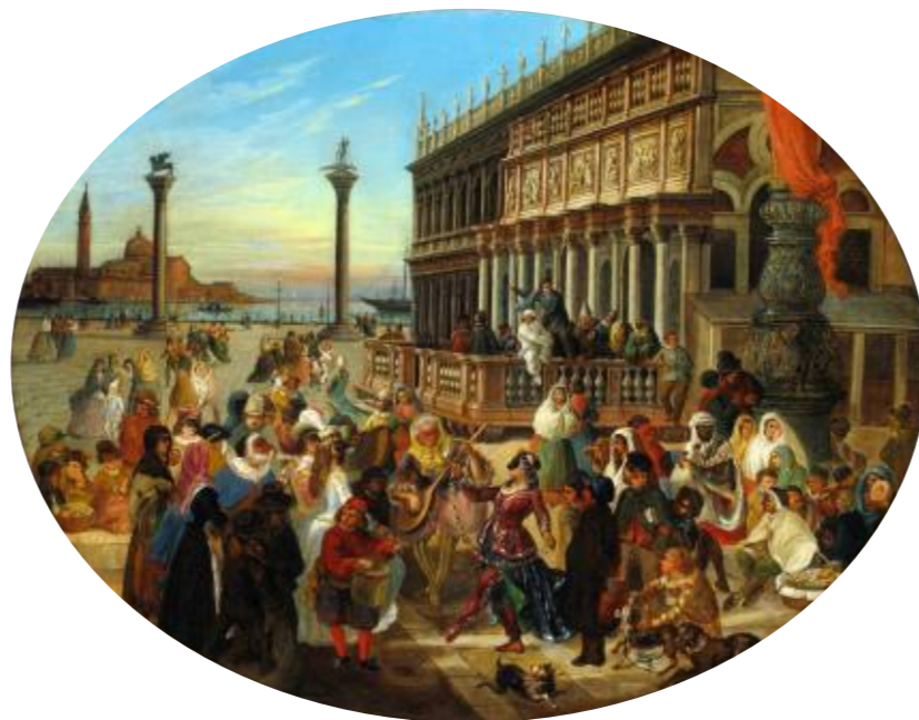
Luigi Querena, Carnevale in Piazzetta . Collezione privata