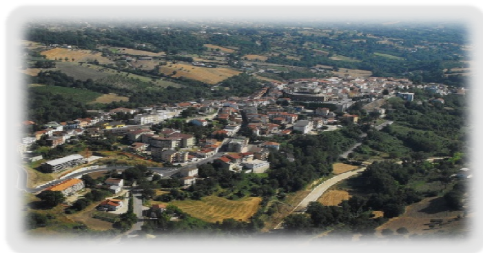
CITTÀ DI MIRABELLA ECLANO