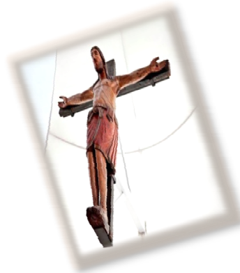
Cattedrale Santa Maria Maggiore Crocifisso Normanno (Sec. XII)