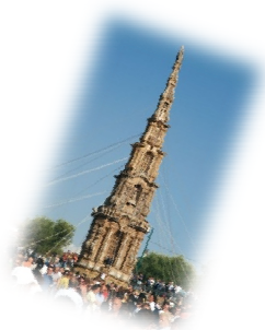
Obelisco di paglia