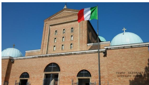
Il Tempio Nazionale dell'Internato Ignoto