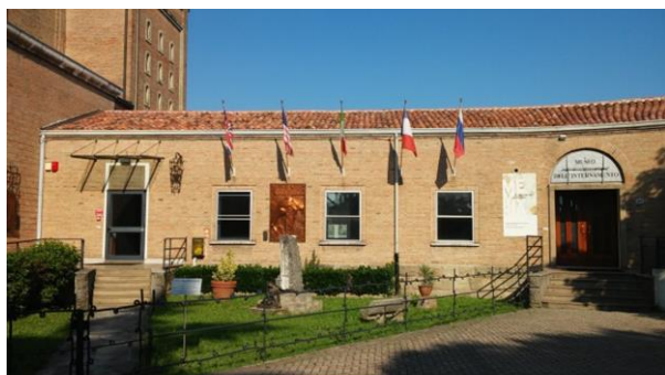
Il Museo Nazionale dell'Internamento