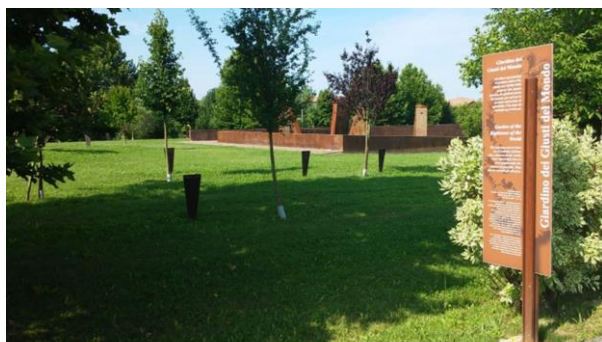
Il Giardino dei Giusti del Mondo