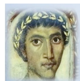
La Commissione Scientifica

Un sincero ringraziamento per la cortese attenzione e un cordiale saluto.